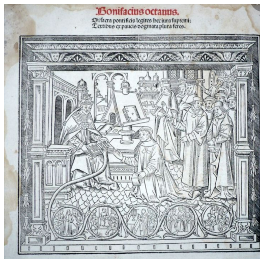
Une des gravures sur bois des Décrétales du Pape Boniface VIII

L'inventaire Général de l'Histoire de France (1647) par Jean de Serre, frère d'Olivier de Serre, le grand agronome du règne d'Henri IV.