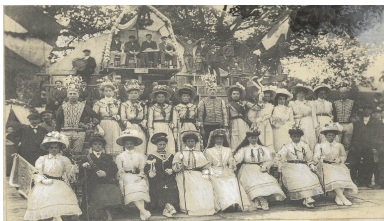
Collection- Médiathèque de Bayonne-Fonds Hérelle (Ms. 112) « Sainte-Hélène » (Photo 2)

Les mêmes filles d'Ordiarp rejouent Sainte-Hélène à Mauléon le dimanche 17 octobre 1909. Irigaray écrit qu'il s'agit d'une représentation « au profit des blessés, de leur catastrophe. ». La représentation a lieu au trinquet, sous la direction de Jean Héguiaphal. Georges Hérelle, présent le jour de la représentation, rapporte dans ses archives qu'il s'agit d'une troupe uniquement constituée de femmes sauf « les rôles des satans, et dans les cas particuliers, ceux du lion et du loup qui doivent enlever les enfants d'Hélène » Pour le reste, « les autres personnages, rois chrétiens ou Turcs, soldats chrétiens ou Turcs, courrier... etc sont des filles ».