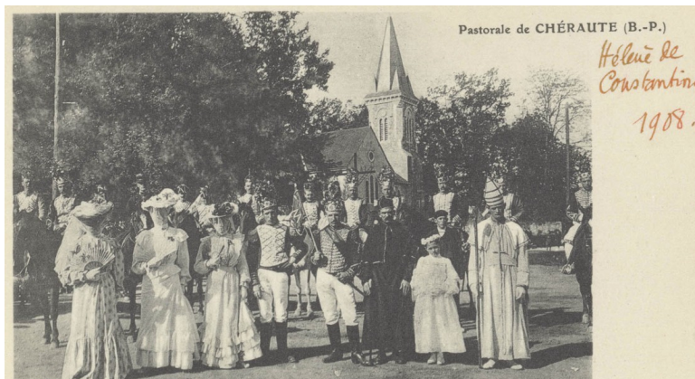
Collection-Médiathèque de Bayonne-Fonds Hérelle (Ms. 112) (Photo 3)

L'année précédente, en 1908, Chéraute joue également Sainte-Hélène en son village, le premier dimanche de Pâques. La particularité de cette représentation réside dans la mixité des acteurs: les rôles des Turcs, de l'évêque, de l'ange et du pape auraient été tenus par des hommes, ainsi que l'atteste la photo (voir Photo 3).